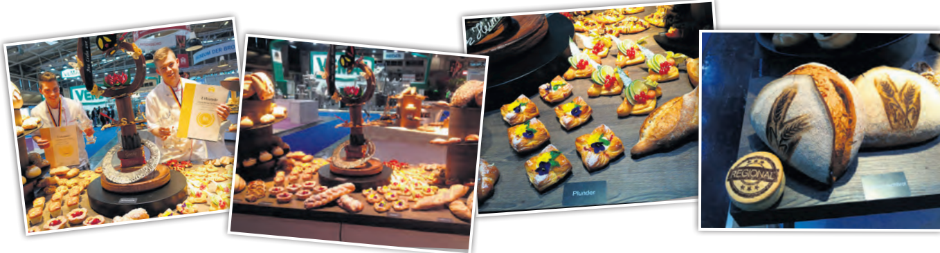
FOTOS VON DER DEUTSCHEN MEISTERSCHAFT DER BÄCKERMEISTER 2015