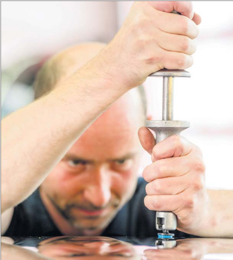
Hagelschäden oder kleinere Unfalldellen sind ein Fall für die spezielle Ausbeultechnik, die bei Kaupp ebenfalls angewendet wird.