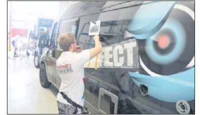
Perfekte Werbefläche: das eigene Fahrzeug

Seit Jahren vertrauen Kunden den Werbepionieren von Kaupp, wenn es um funktionelle und schöne Außenwerbung geht – egal ob in Form von bedruckten Schildern, beschrifteter Fahrzeuge oder großflä-