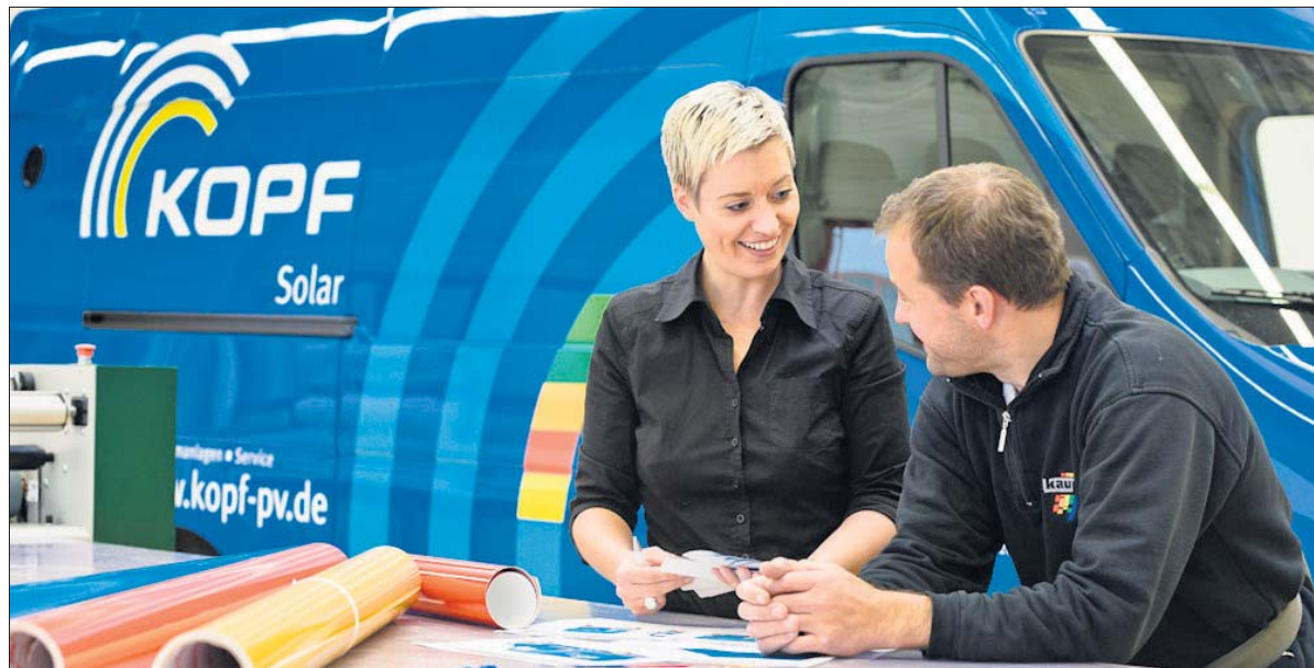
Ein kompetentes und eingespieltes Team von Werbetechnikern und Grafikdesignern steht den Kunden bei Konzeption, Beratung und Umsetzung der Werbung zur Verfügung.

Unser Vorteil ist, dass wir die vier Unternehmensbereiche klar strukturiert und inhaltlich neu definiert sowie weiterentwickelt haben. Wir verfeinern das, was einst begonnen wurde, ganz nach dem Motto: »Die erste Generation baut auf, die zweite Generation baut aus.«