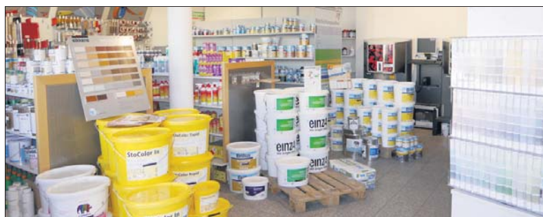
Der Fachmarkt bietet ein großes Sortiment an Heimwerkerbedarf.

Dank Computersteuerung und moderner Abfüllanlagen kann jeder Lack in jedem Wunschfarbton hergestellt und sogar beispielsweise in Spraydosen abgefüllt werden.