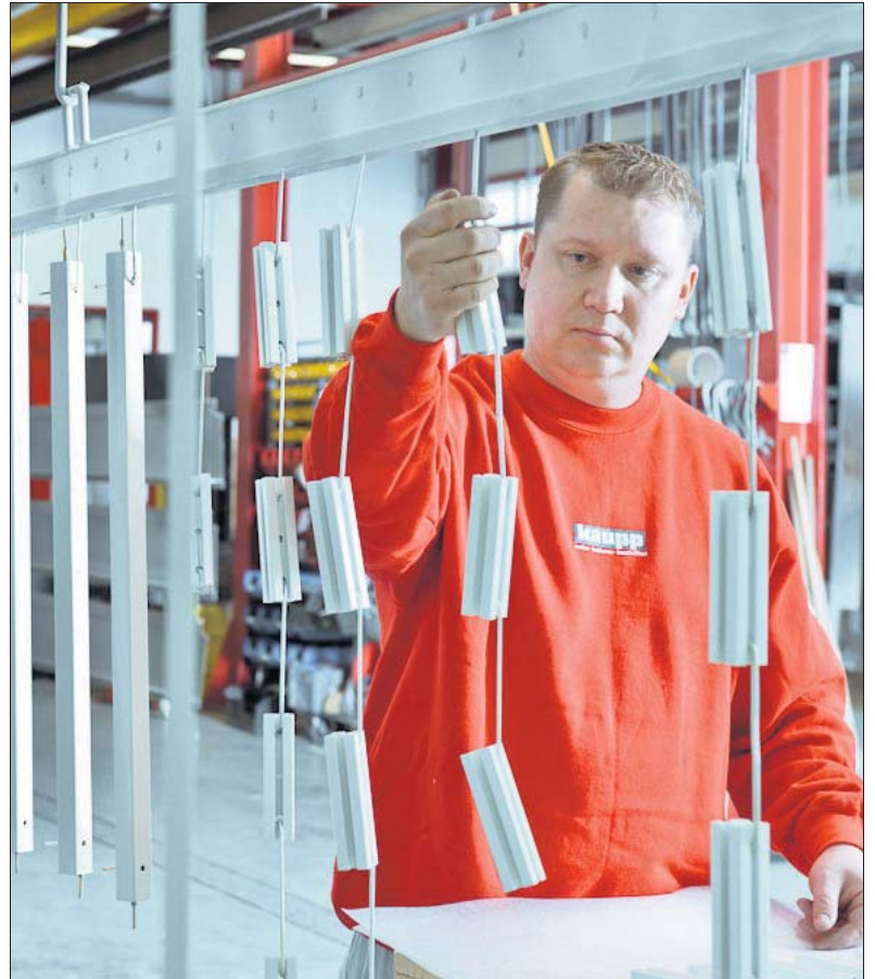
Alles schön trocken? Ein Mitarbeiter kontrolliert die fertigen Teile.

Diesem Anspruch wird im Kaupp Industrielackierzentrum & Pulverbeschichtungen durch verschiedene Arbeitsverfahren, eine große Produktvielfalt und einen umfassenden Service Rechnung getragen. Auf diese Weise erhalten vielfältigste Industrieteile nicht nur eine optische Veredelung, sondern werden auch zuverlässig gegen äußere Einflüsse wie beispielsweise Korrosion geschützt.