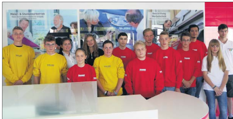
Ausbildung wird bei Kaupp seit jeher großgeschrieben – hier die Auszubildenden 2016.

Mit dem Kaupp ProfiNetz, dem internen Weiterbildungsprogramm für Mitarbeiter der Kaupp-Unternehmensgruppe, will Kaupp eine möglichst erfolgreiche Aus- und Weiterbildung gewährleisten. Die Seminare und Schulungen finden