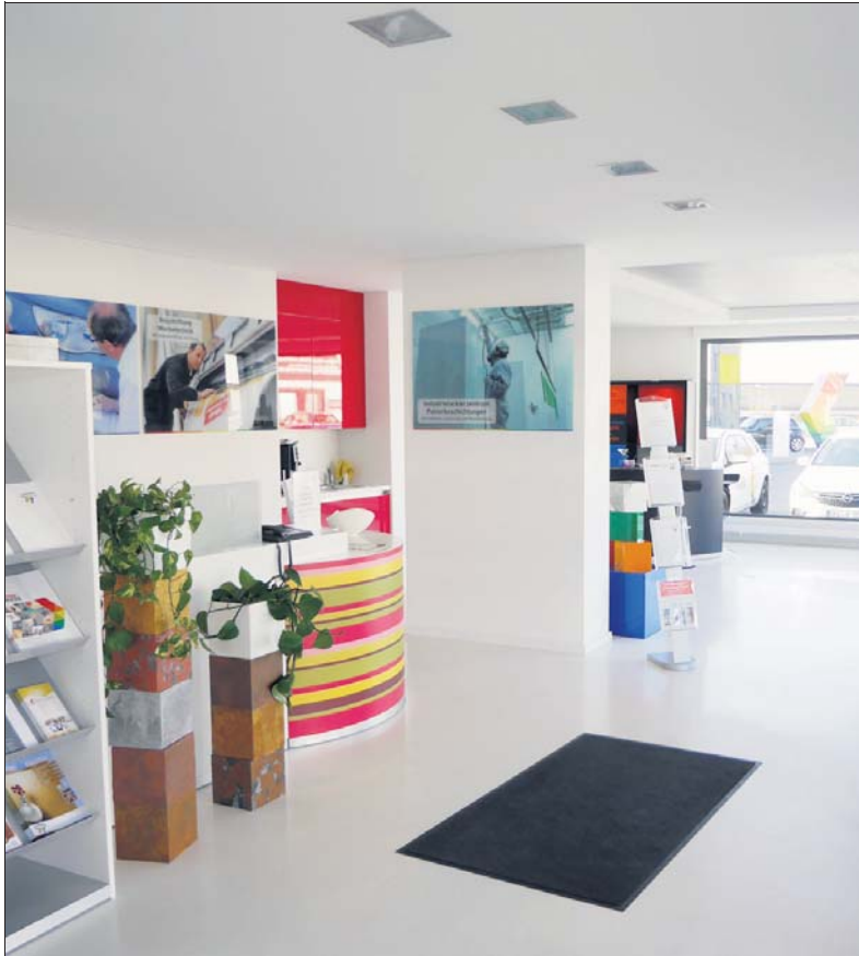
In den Ausstellungsräumen können Kunden sich über die vielfältigen Gestaltungsmöglichkeiten informieren.