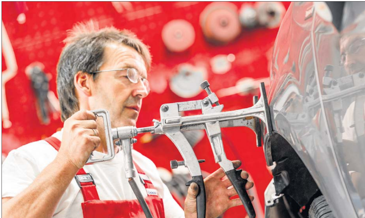
Mechanik- und Servicearbeiten wie das Vermessen von Achsen gehören zum Instandsetzungsservice dazu.

Kunden, die besondere Wünsche bezüglich der Optik ihres Fahrzeugs haben, sind im Kaupp-Karosserie- und Fahrzeuglackierzentrum ebenfalls an der richtigen Adresse. Spezielle Farben mit Metallic- oder Pearlpigmenten machen jede Oberfläche zum Unikat. Sonderfahrzeuge, wie zum Beispiel schöne Oldtimer, deren Restaurierung und Lackierung viel Fachwissen erfordern, findet man deshalb dort nicht selten.