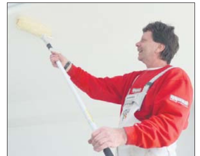
Malerarbeiten gehören seit 50 Jahren zum Schwerpunkt.

Mit der breit aufgestellten Leistungspalette und speziell geschulten Mitarbeitern können Privat- oder Gewerbekunden bei Kaupp ein »Rundum-Sorglos-Paket« buchen.