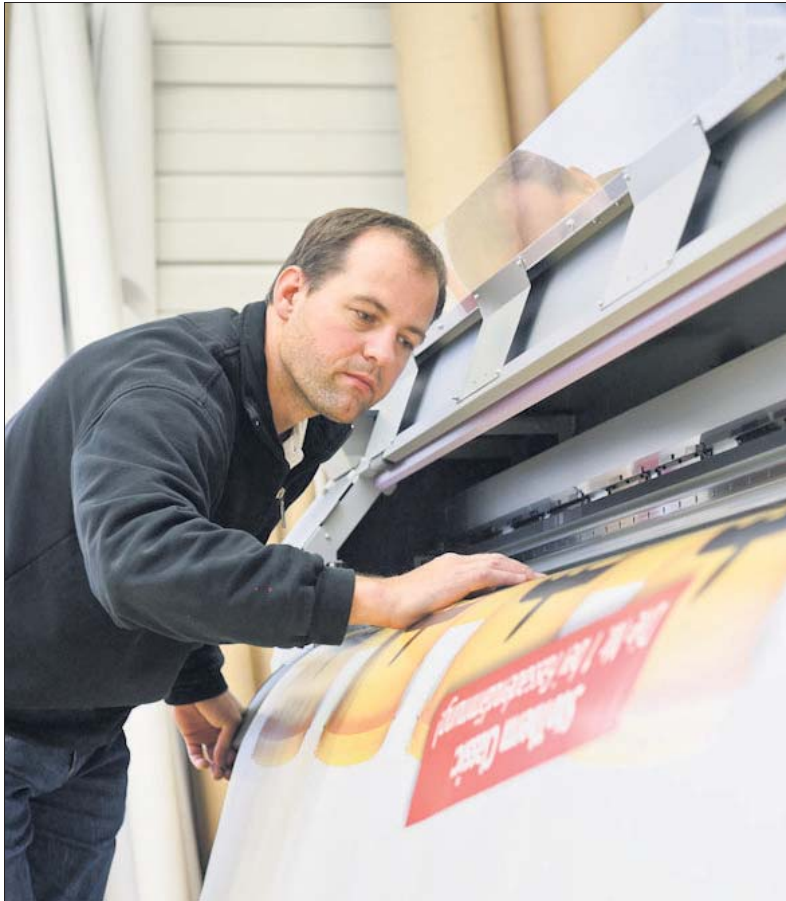
Modernste Technik ermöglicht auch Digitaldrucke in Großformat.