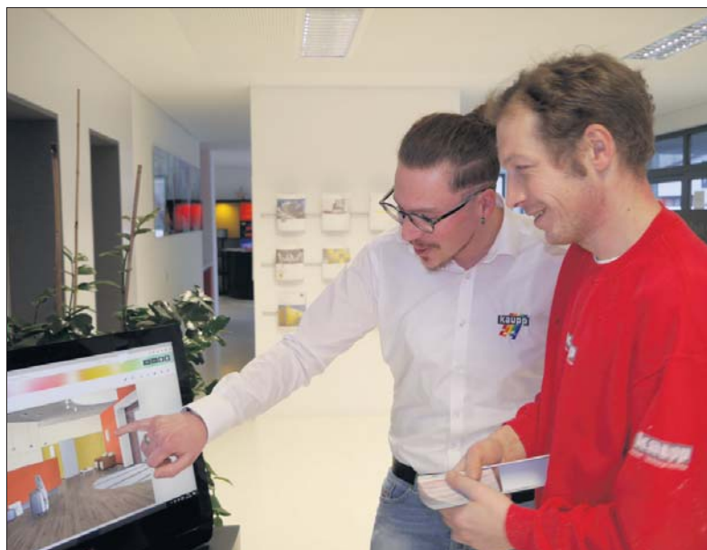
Bei Kaupp erhalten Kunden eine komplette Beratung und eine visuelle Planung ihres Sanierungsvorhabens.

Mit ausgewählten Materialien werden Innen- und Außenflächen fachmännisch verputzt.