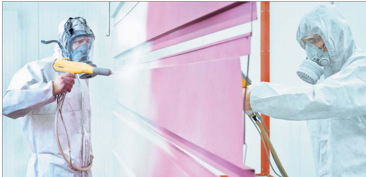
Beim Pulverbeschichtungsverfahren werden sämtliche industrielle Oberflächen veredelt.

Fuhrpark, sodass eine sichere und schnelle An- und Auslieferung auch empfindlicher und sperriger Teile sichergestellt werden kann.