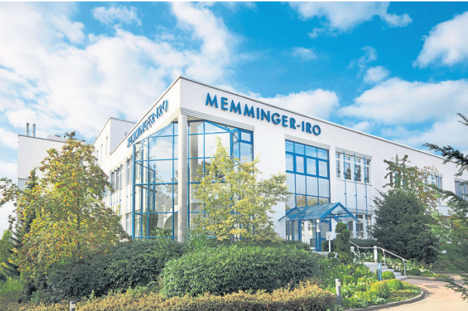
Allein in Dornstetten garantieren 200 Mitarbeiterinnen und Mitarbeiter den nachhaltigen Erfolg.

in mehr als 100 Länder. Die Verantwortlichen bei Memminger-IRO kennen die Anforderungen der Märkte dabei ganz genau und entwickeln Produkte und Dienstleistungen zum Nutzen ihrer Kunden kontinuierlich weiter. Zukunftsweisende nationale und internationale Projekte mit Größen der Textilbranche, unter anderem aus den Bereichen Sport, Mode, Medizin und technische Textilien, fordern die Innovationskraft der Memminger-IRO GmbH. Zielorientiert und partnerschaftlich sind die Schlüsselbegriffe für den dauerhaften Geschäftserfolg von Memminger-IRO. Auch die Aus- und Weiterbildung der Beschäftigten nimmt Memminger-IRO sehr ernst. Das Prinzip „Fördern und Fordern“ wird konsequent angewandt. Die Mitarbeiterinnen und Mitarbeiter bringen ihre Kompetenz engagiert in den täglichen Arbeitsprozess ein und haben das gemeinsame Unternehmensziel stets vor Augen – nur so ist ein solcher kontinuierlicher Erfolg überhaupt realisierbar.